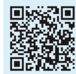
ボランティア登録は こちらから