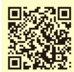
ボランティアの種類と一覧

気になる活動があれば那覇市ボランティア・市民活動センターまで、お気軽にお問合せください。