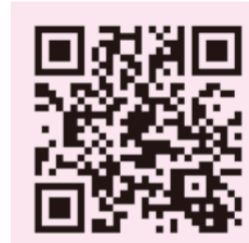
ボランティア情報は こちらから