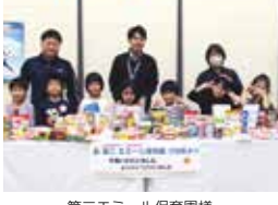
第二エミール保育園様