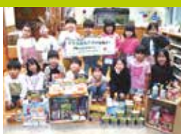
首里当蔵保育園様