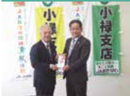
JAおきなわ小禄支店様