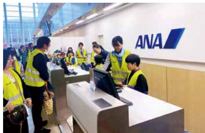
チェックカウンター体験の様子