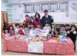
かねしま保育園様