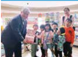
おおたけ保育園様