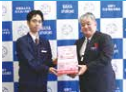
沖縄都市モノレール株式会社様