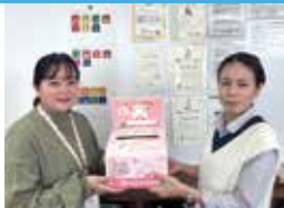
株式会社大央ハウジング様