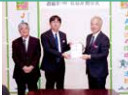
JAおきなわ真和志支店様