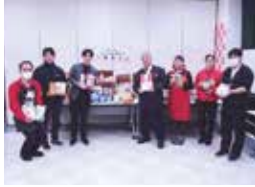
コープおきなわ首里、寒川、こくば、あつがるタウン、小禄様