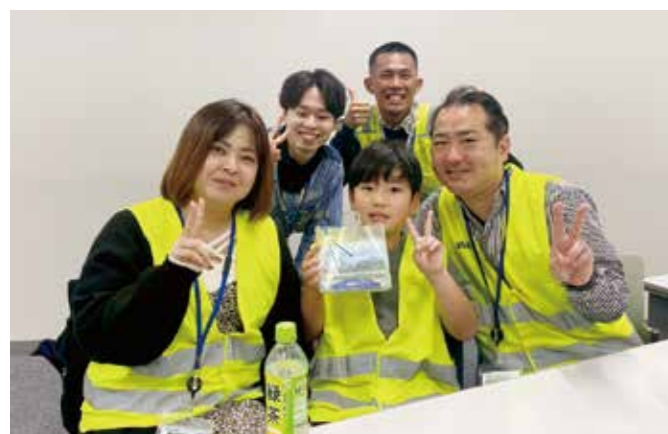
参加した親子とANA社員