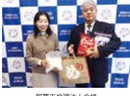
那覇市倫理法人会様