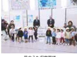
風のうた保育園様