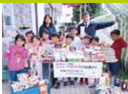
花のうた保育園様