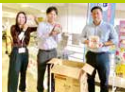
沖縄製粉株式会社様