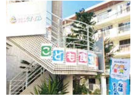
こども食堂スマイル

金城3-5-4 那覇市総合福祉センター1階ラウンジ 開催日時:金曜日(月2～3回不定期) 16:00～17:00