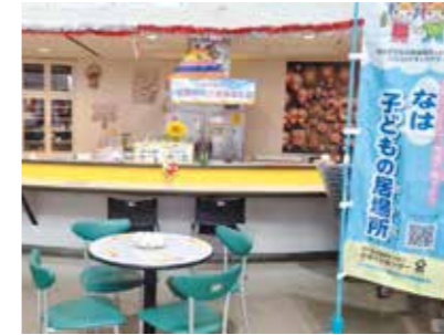
子どもの居場所 和(わ)

また、田原で放課後児童デイサービスをしているスマイルが小禄市営住宅のお隣で隔週土曜日にこどもも大人もどなたでも気軽に参加できて、温かいご飯が食べられる「こども食堂スマイル」を開催しています。(松長)