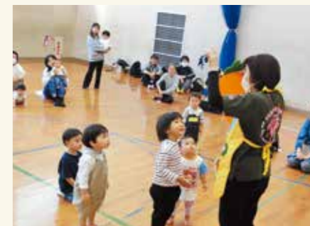
担当保育士による遊びの提供