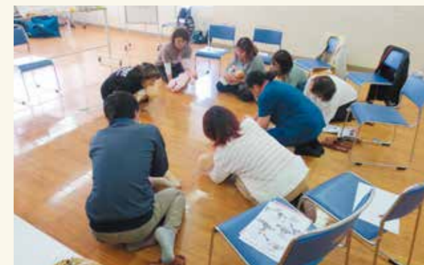
保育サービス講習会2月 救急救命

ファミリーサポートセンターは、育児の援助を受けたい人(依頼会員)と援助を行いたい人(協力会員)が会員となって有償で援助活動を行う会員組織です。那覇市では設立から20年が過ぎ、会員数は令和6年3月末現在、総会員数が2906人で、開設当初から約14倍に増えています。新型コロナウイルス感染症の位置づけが「5類」へ移行され、子どもたちの学校や働く親の環境も日常へと戻っていく中でニーズは高まり、習い事の送迎や親の外出時の預かり依頼が増加傾向にあります。活動拠点も協力会員の家庭だけではなく、児童館や子育て支援センターの活用で幅広く子育ての輪が地域へと広がっています。私たちアドバイザーは、地域の子育て中のパパやママを支える強い味方でありたいと思いながら、コーディネートしています。(担当:青木)