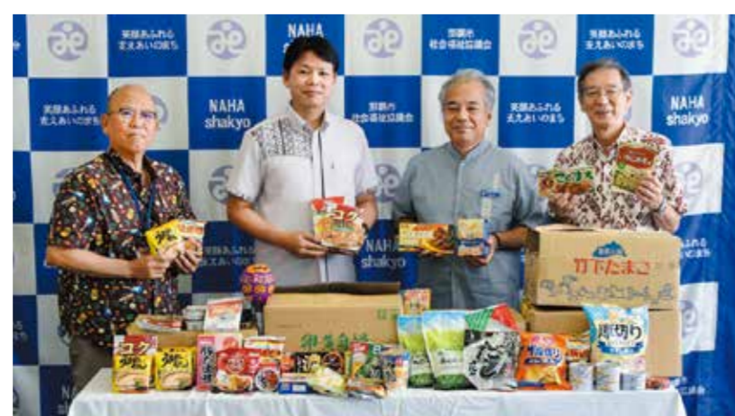
寄贈された食品など

皆様のお近くのリウボウストアでフードドライブBOXを見かけましたら、優しさのおすそ分けとして、ぜひフードドライブにご協力ください。 (担当:仲程)