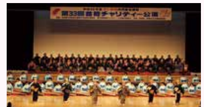
芸能チャリティー公演