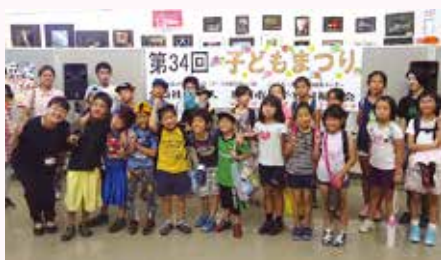
母子会子どもまつり