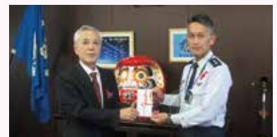
航空自衛隊より寄付金贈呈