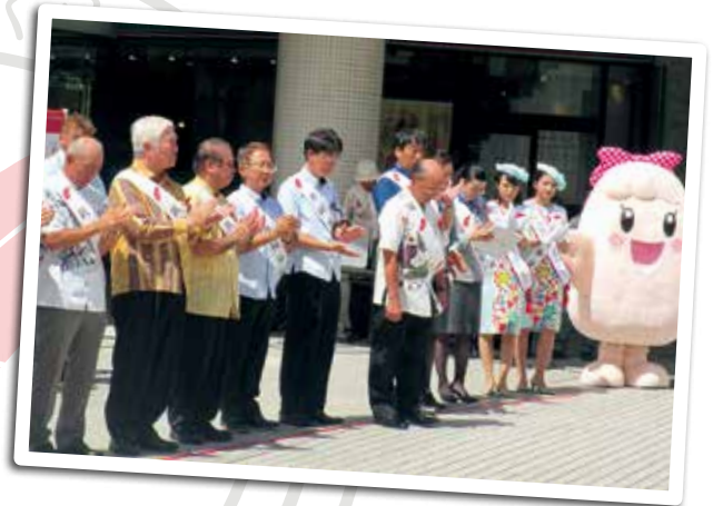
赤い羽根募金伝達式(10月1日)

今年度も各自治会や個人、事業所等へ募金の協力をお願いいたしますので、ご理解とご協力をお願いいたします。