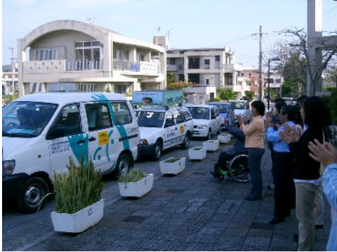
防犯パトロール出発式