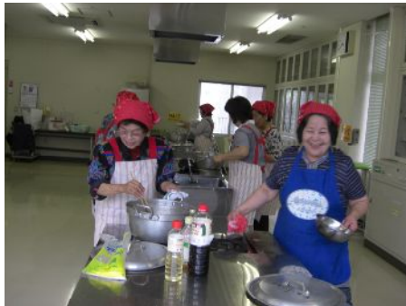
ふれあい給食サービス調理風景