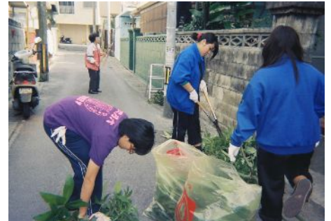
歳末おそうじ隊活動風景