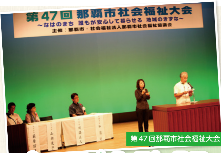
第47回那覇市社会福祉大会