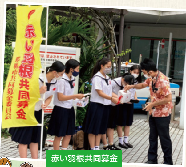
赤い羽根共同募金