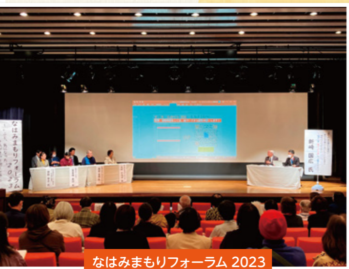
なはみまもりフォーラム 2023