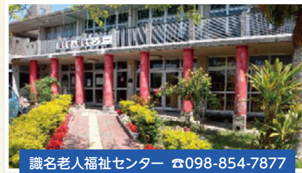
識名老人福祉センター ☎098-854-7877 識名児童館 ☎098-854-9656