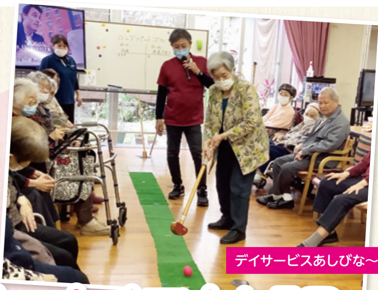
デイサービスあしびな～