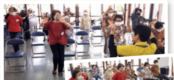
▲久しぶりにみんなで体操!

みなさん新しい生活様式にも慣れ、きちんとマスクをして来所し、入り口で消毒してから着席していました。約1か月ぶりの再開に、参加者・ボランティアとも満面の笑みをうかべ、お互い距離を保ちつつ、休みの間の出来事やお互いの健康について、活動が始まるギリギリまで語り合っていました。