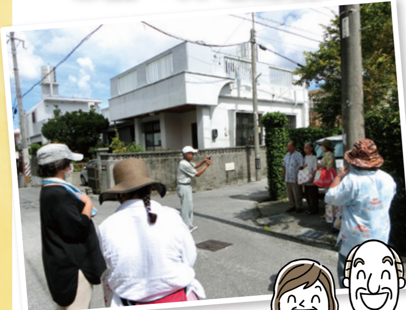
▲お祝いの品をお届けしながら自宅前でハイチーズ♪

9月19日（土）「おはようございます！自治会です。」と元気な声がこだまする中、80歳以上の方がいる50世帯へ敬老祝いと見守りを兼ねた訪問が石嶺ハイツ自治会で行われました。明るい呼びかけに皆さん笑顔で出て来られ、祝いの品と共に訪問した皆さんで記念撮影。