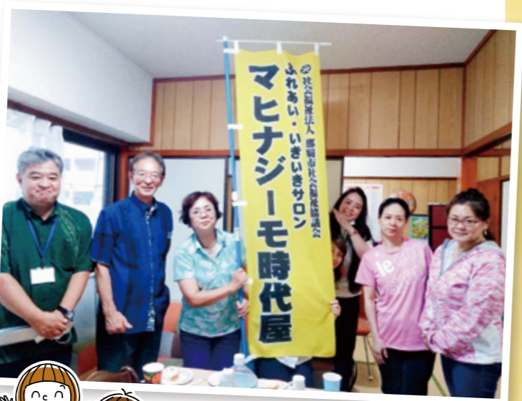
▲那覇社協と那覇市地域包括支援センターも訪問