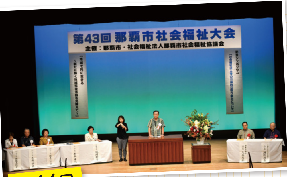
第43回 那覇市社会福祉大会 主催：那覇市・社会福祉法人那覇市社会福祉協議会