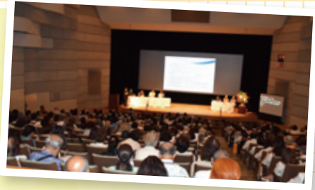
▲シンポジウムの様子

対象となり得る福祉団体等へ推薦のご案内を行い、被表彰者を決定しております。今後は更に多くの社会福祉活動功労者の表彰を行いたいと思っています！ 本会ホームページ等でも被表彰者を募集致しますので、お気軽にお問い合わせください！