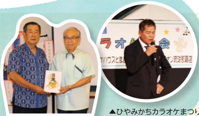
▲チャリティゴルフ大会 寄附金贈呈

社協の庶務・会計や広報、財源確保のための企画（会員募集・チャリティ）等を行っています。また、赤い羽根でおなじみの共同募金の事務局も担当しており、募金活動等の調整も行っていきます。