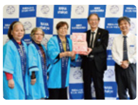
那覇市シルバー人材センター女性部