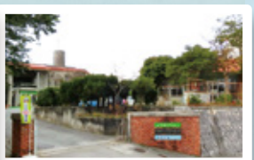
▲小禄老人福祉センター 小禄児童館