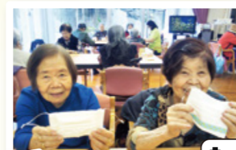
▲完成しました! 上手にできました!!