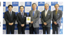
JAおきなわ真和志支店