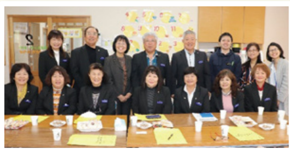
▲安謝新都心こども広場で記念撮影

移動の車中で“サポートセンター糸”の事業説明や子どもの居場所についてお話をさせていただきました。訪問先でお話を聞いて、居場所の在り方や運営方法の違い、子どもたち・親御さんとの関わりなど代表者の想いを聞き、感動し涙される方もいました。