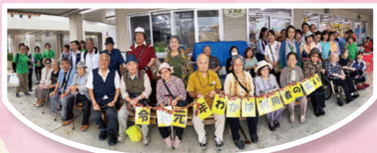
▲ホームヘルプステーションわかば 利用者の集い