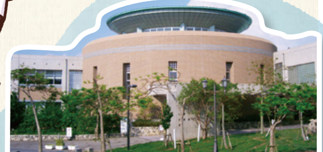
▲金城老人憩の家・金城児童館