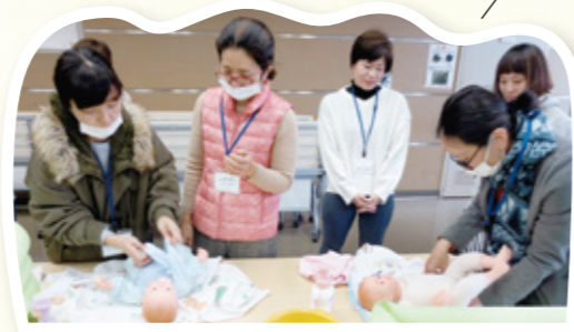
▲赤ちゃんの人形を使って沐浴に挑戦