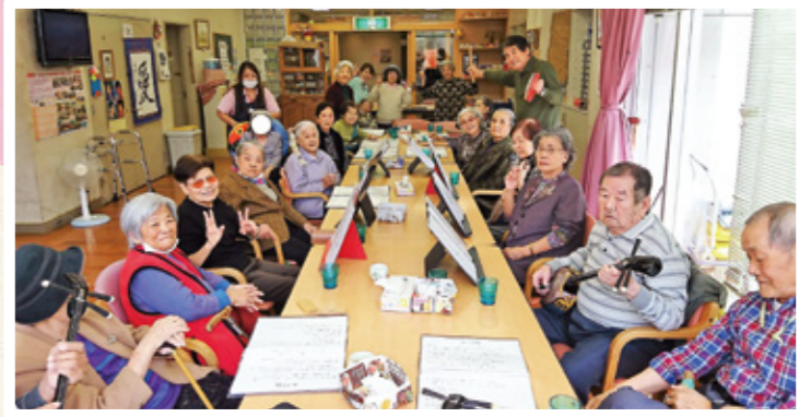
▲デイサービスあしびなー 三線教室

ヘルパーステーションやデイサービス、ケアマネジャーといった介護保険事業と障がい者生活支援センターゆいゆいや、ファミリーサポートセンターなどの子育て支援の委託事業を行っています。