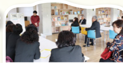
▲放課後こくば教室で説明を受ける宜野座村民児協の皆様

宜野座村社協から民生委員児童委員の就任研修として、那覇市内の子どもの居場所を視察訪問させて頂きたいというご相談を受け、2月20日(木)に宜野座村社協・民生委員児童委員のみなさんと「放課後こくば教室」「安謝新都心こども広場」の2ヶ所を訪問しました!