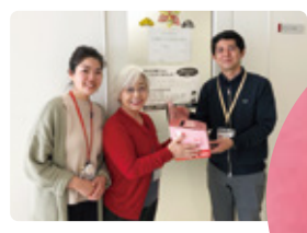
NPO法人 沖縄県立美術館 支援会 happ