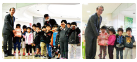
社会福祉法人大竹福祉会 おおたけ保育園&まつやま保育園