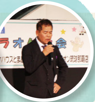
▲ひやみかちカラオケまつり