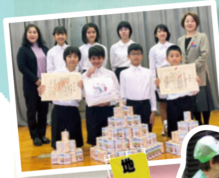
▲赤い羽根共同募金贈呈式