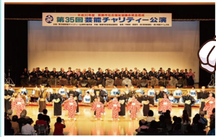
▲芸能チャリティ公演