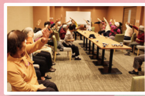
▲那覇市地域ふれあいデイサービス

地域福祉推進の為に多くの事業を実施しております。ボランティア・市民活動センターの運営や地域見守り隊の推進、ふれあいデイサービス事業や子ども支援団体等へのサポート事業、ふれあい相談室など多くの地域福祉推進事業を展開しています。