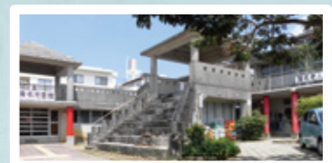
▲識名老人福祉センター 識名児童館