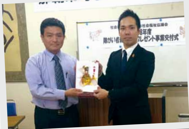
▲琉球銀行労働組合(写真-右)よりボランティアBOX目録の贈呈