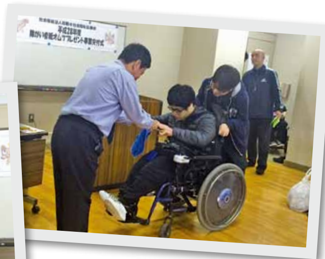
▲紙オムツ券の交付式の様子