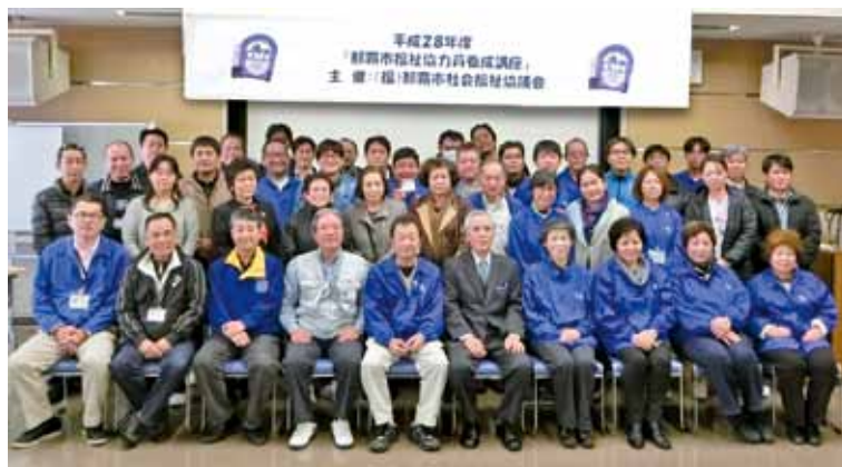
▲沖縄タイムス社販売店対象福祉協力員養成講座