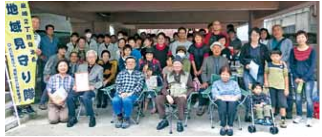
▲泉崎2丁目自治会の皆さん

地域のつながりがより一層深まるよう、私たち社会福祉協議会も活動をサポートしていきます。