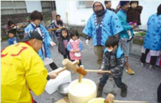
地域ふれあい交流事業

今年度は、9,000,000円を目標額とし、生活困窮世帯への支援や地域の交流事業などで活用していきたいと思っておりますので、皆さまの善意をお寄せ下さい。