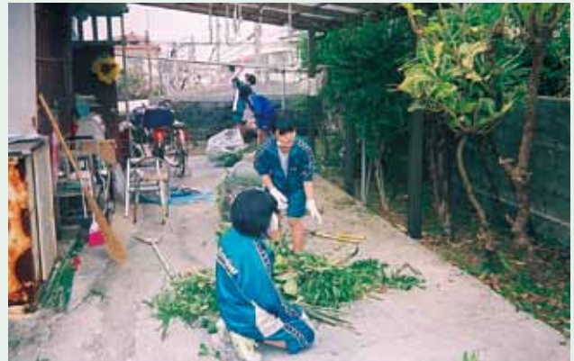
高齢者等生活支援事業（歳末おそうじ隊）