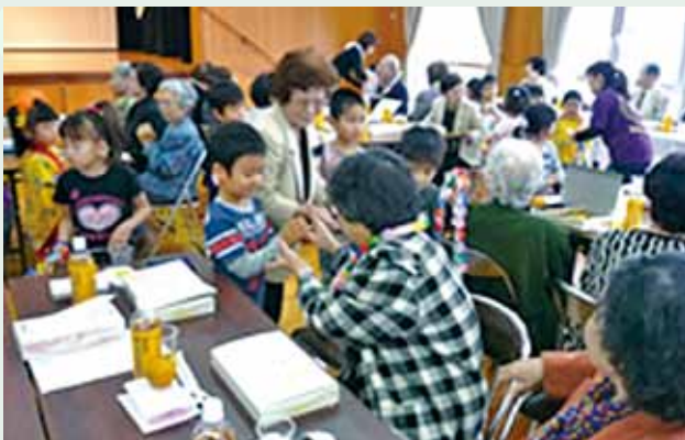
地域見守り交流事業（ふれあい昼食会）