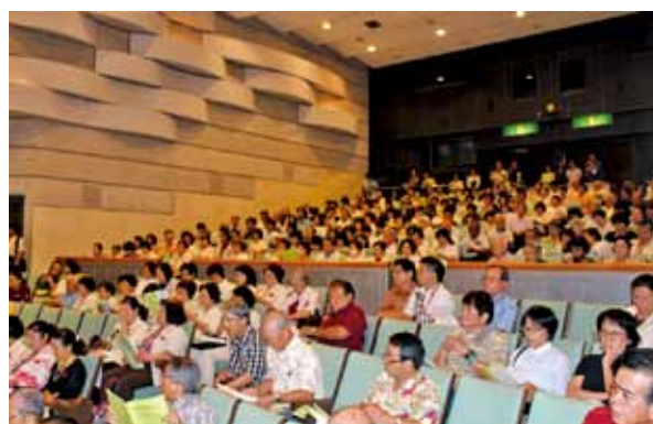
▲第2部で話しの内容を聞き入る参加者たち。