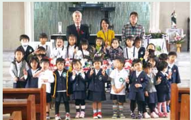
生活困窮世帯への缶詰寄贈（愛児幼稚園）