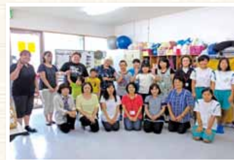
▲8月児童デイサービスアンナ訪問 「お子さんとスタッフ・会員の皆さんと一緒に」