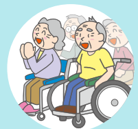
※障害福祉サービスのみ