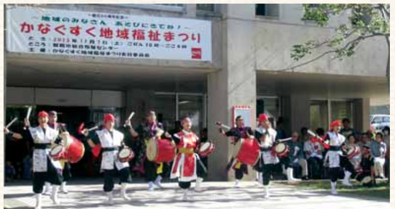
▲オープニングセレモニーの様子 (H27.11.7)

日 時：平成28年11月12日(土) 10:00~17:00 場 所：那覇市総合福祉センター及びその周辺 内 容：舞台発表・展示発表・スタンプラリー・ ハンドマッサージ・遊びコーナー・フリーマーケットなど