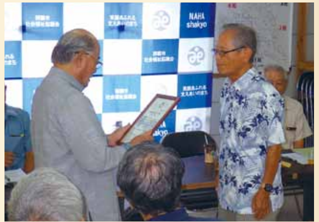
▲認証第29号「安謝新都心自治会若水会地域見守り隊」の結成式。

これを契機に市内単位老人クラブが活性化し繋がっていければと思います。自治会・老人クラブ・包括支援センター・民生委員児童委員・社会福祉協議会・行政と関係機関が団結して見守り活動を推進していきます。