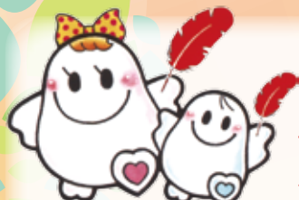
愛ちゃんと希望くん