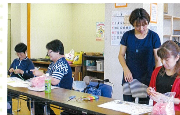
スズランテープで作るスマホケース